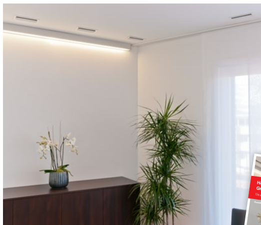
Le système HomeVent® propose un grand choix de grilles design stylées pour l'entrée et la sortie d'air. Demandez le prospectus « Grilles design HomeVent® ».