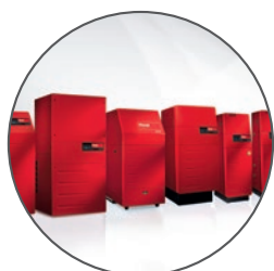
Hoval Générateurs de chaleur

Hoval livre tous les composants pour un système de chauffage et d'aération douce. La régulation système Hoval TopTronic® E relie tous les composants pour constituer un système global efficace. Pour vous, cela est synonyme de commande uniforme et de composants adaptés les uns aux autres.