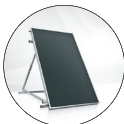
Hoval Installation solaire